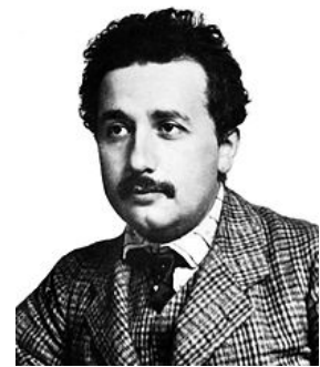
Fig. 1: Albert Einstein

Dit foto-elektrisch effect genoemd werd verder onderzocht door J.J. Thomson en Philipp Lenard. Thomson stelde in 1899 vast dat bij het ontladen van de metalen plaat een zelfde soort negatief geladen deeltjes uit de plaat vrijkwam als de deeltjes in de zogenaamde 'kathodestrallen'. Deze deeltjes werden kort daarna bekend als elektronen. Lenard (fig. 2 deed in 1902 een reeks experimenten met enkele verrassende resultaten. Zo ontdekte hij dat de intensiteit van het licht alleen invloed heeft op de snelheid waarmee de plaat ontladen wordt, maar niet op de snelheid waarmee de vrijgekomen elektronen bewegen. Vertaald in grootheden: de stralingsenergie die per seconde door de plaat geabsorbeerd wordt heeft alleen invloed op het aantal elektronen dat per seconde vrijkomt, en niet op de kinetische energie van de elektronen. Maar, de snelheid van de elektronen bleek wél af te hangen van de frequentie van het licht dat op de metalen plaat viel. De verklaring van deze waarnemingen werd oorspronkelijk gezocht in de eigenschappen van de atomen waaruit het metaal is opgebouwd. Aangezien men deze eigenschappen rond 1900 nog niet kende, kon men hier vrijuit hypothesen over opstellen.