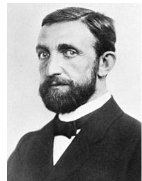
Fig. 2: Philip Lenard